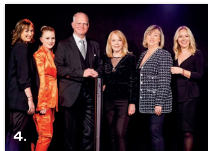
Business Circle Baden 2004 mit Armin Assinger